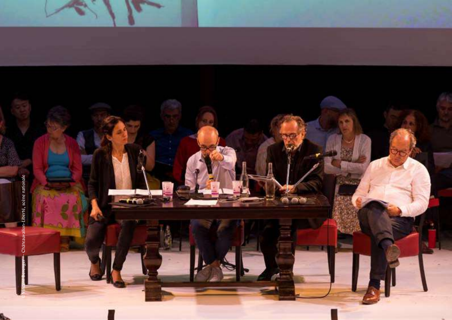
© Vincent Berengère — Châteaueuallon-Liberté, scène nationale