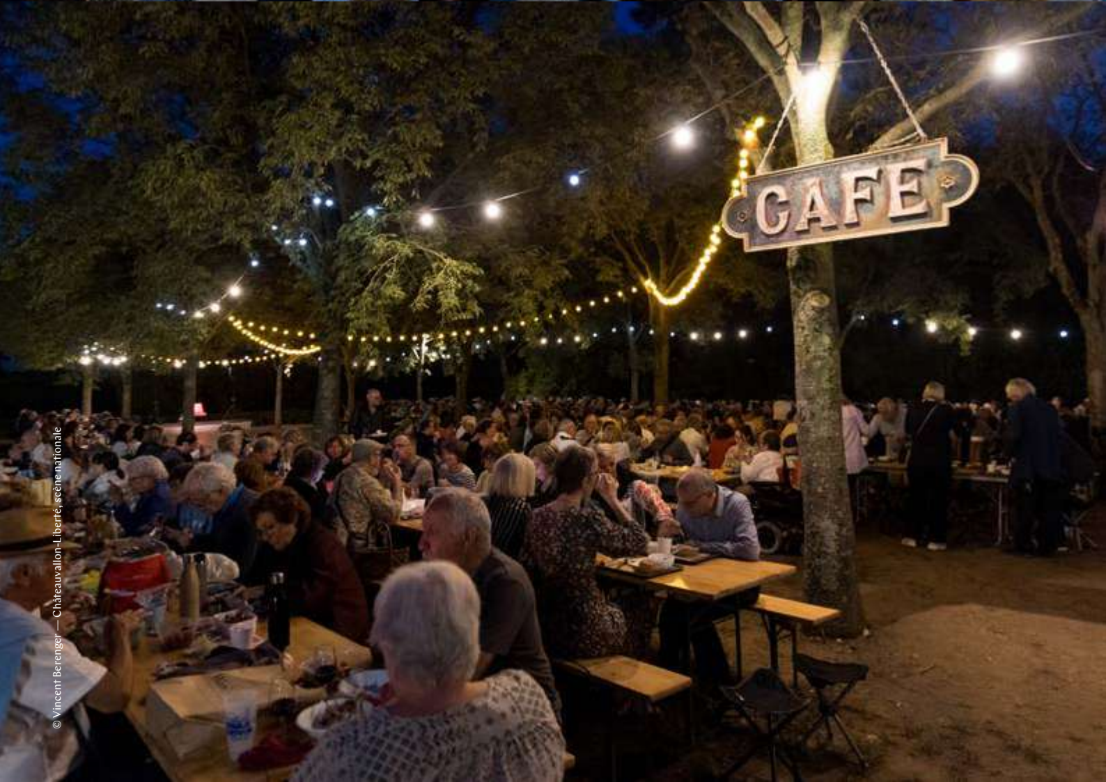
© Vincent Berengier — Châteaueuallon-Liberté, scène nationale