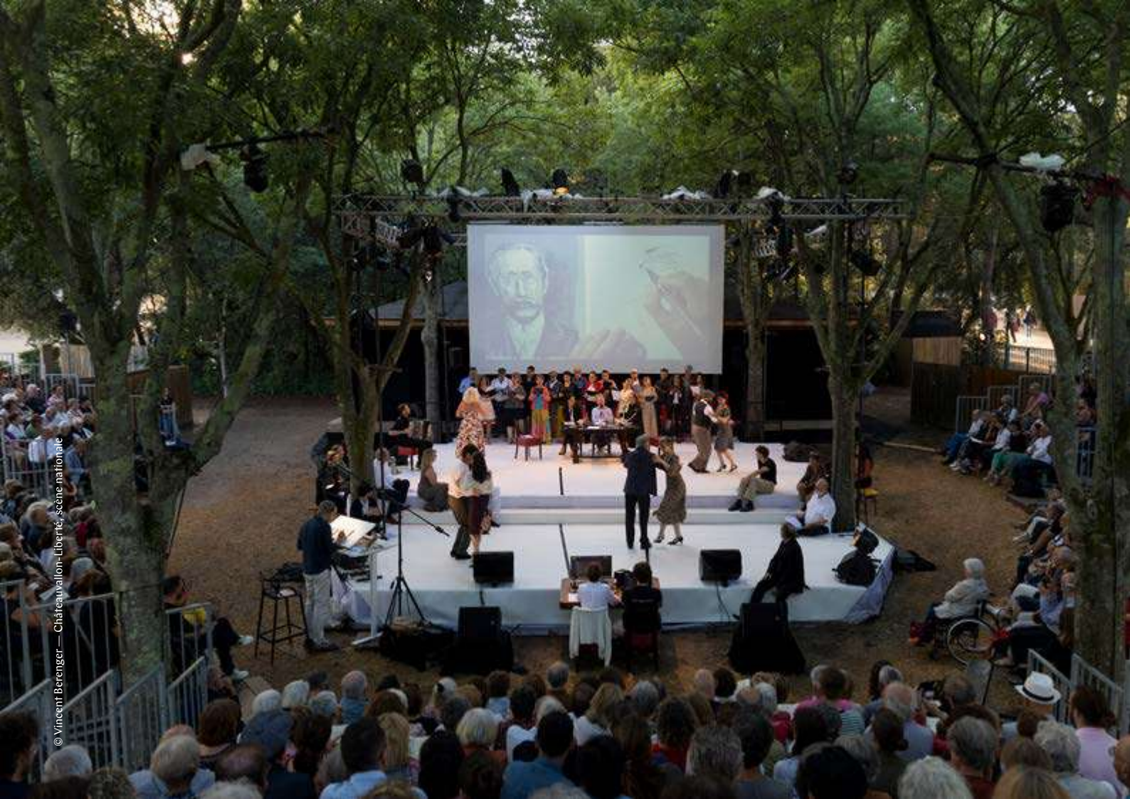
© Vincent Berengier — Châteaueuallon-Liberté, scène nationale