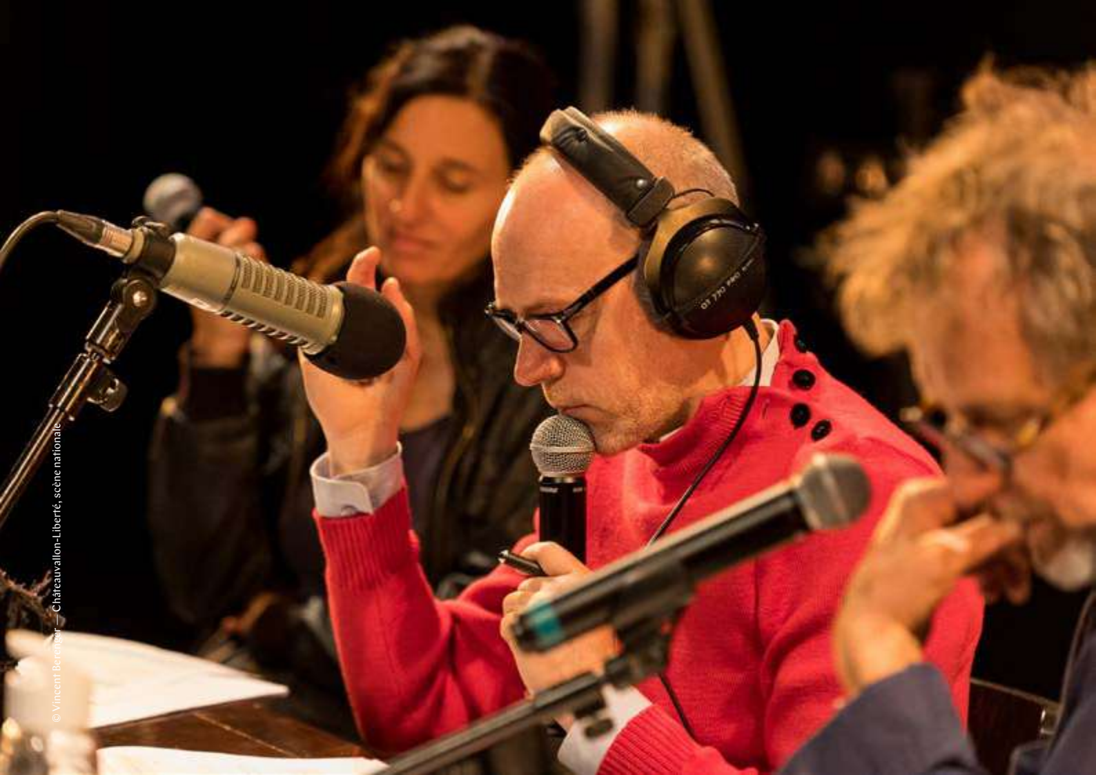
© Vincent Berengère — Châteaueuallon-Liberté, scène nationale