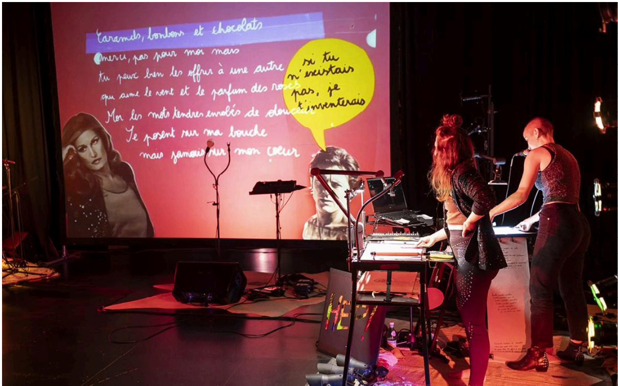
Hep! Hep! Hep! (karaoké dessiné).